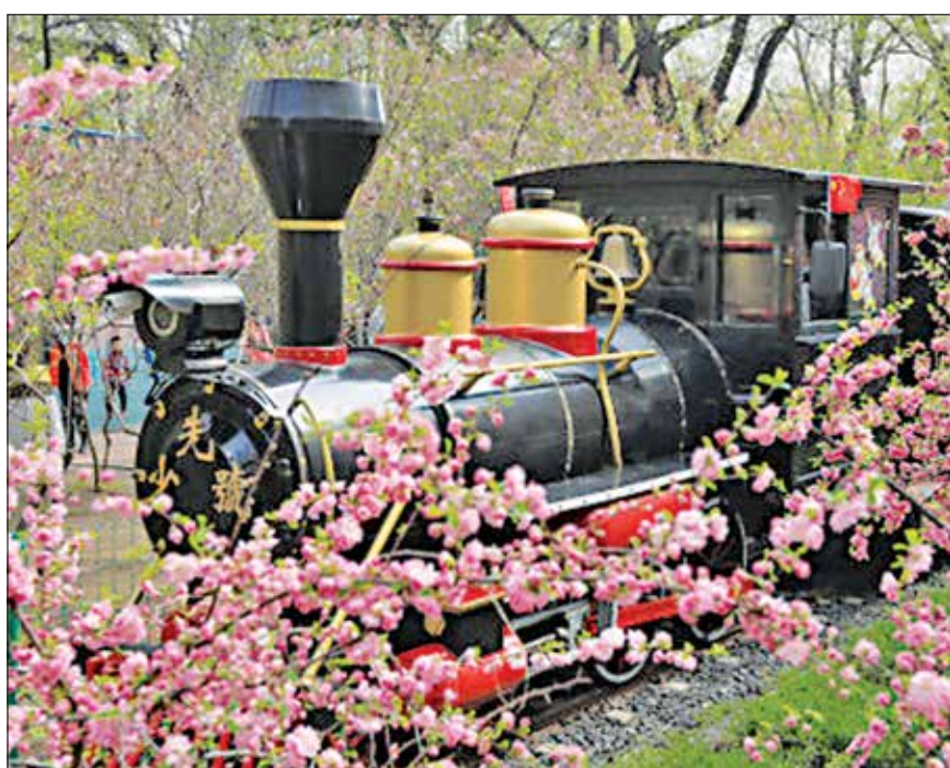
Град Харбин: Детско влакче сред море от цветя

приятелството между двете страни. „Италия е световен лидер в областта на машините, биомедицината, луксозните стоки, дизайна, селскостопанските храни и други области. Очакваме с нетърпение да реализираме повече сътрудничество по проекти с китайски партньори в Нанкин“.