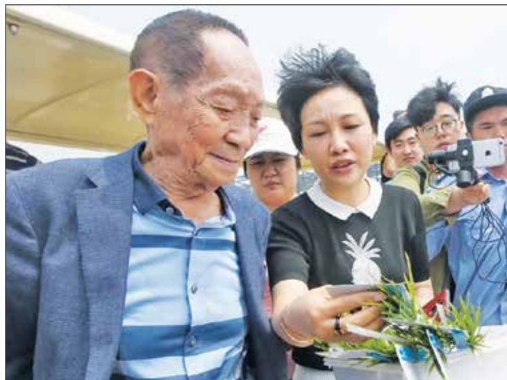
През последните десетилетия пионерът на създаването и развитието на хибридния ориз е обучил над 14 000 души в тази технология в КНР и в повече от 80 развиващи се страни

хибриден оризов щам с висок добив през 1973 г., който след това започна да се отглежда в големи мащаби в Китай и други държави. През следващите четири десетилетия той продължи с изследванията и надгражданията, достигайки до трето поколение хибриден ориз. „Видях сърцераздирателни сцени на хора, които умираха от глад преди 1949 г. Това бе основната причина да започна изследванията за култивиране на хибридния ориз“, спомня си Юен Лунпин в едно интервю.