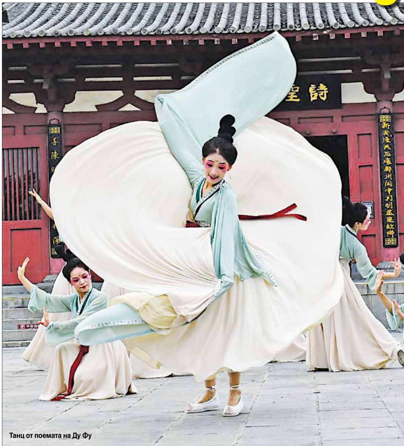
Танц от поемата на Ду Фу

▶ Танцуващи актриси пресъздават епохата в поемата на Ду Фу – известен китайски поет от династията Тан. От поетичното му писание през