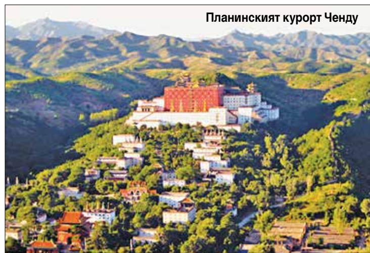
Планинският курорт Ченду

40% от работната сила е заета в секторите