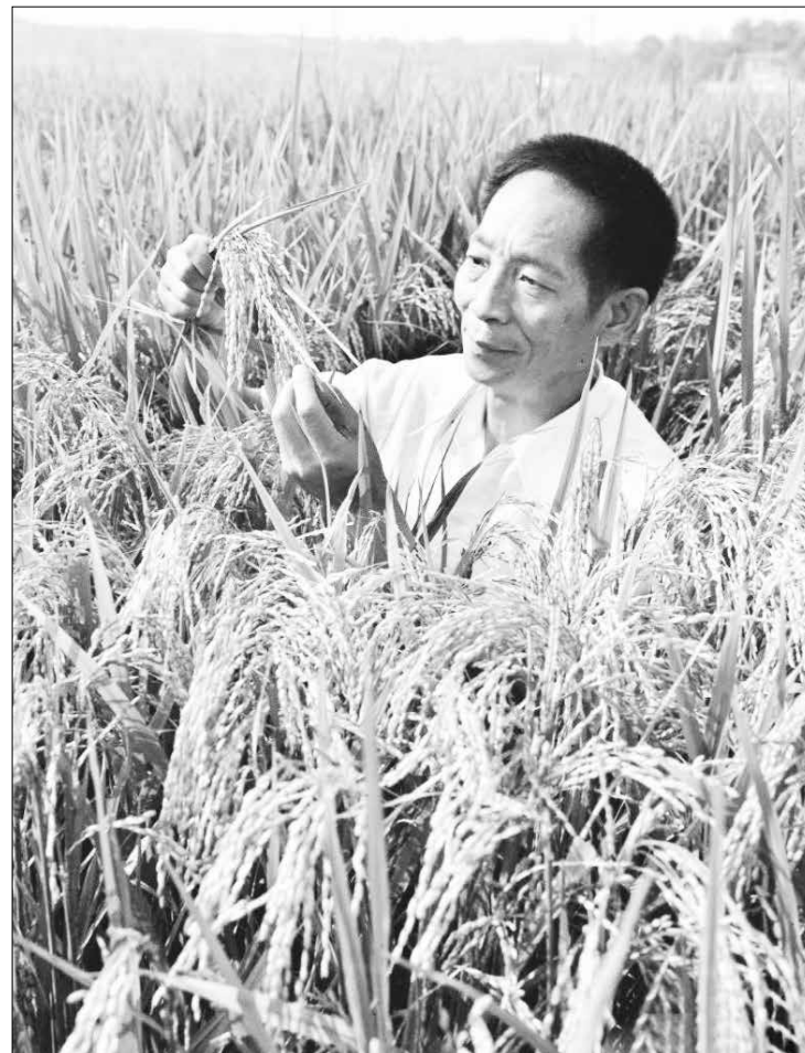
Академик Юен Лунпин е първият учен в света, който успя да подсили хибридни сортове ориз, с което си спечели славата на баща на хибридния ориз

В началото на 90-те години Организацията по прехрана и земеделие на ООН обяви популяризирането на хибридния ориз като първа стратегическа мярка за решаването на проблема с недостига на храна в развиващите се