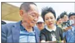
Юен Лунпин – бащата на хибридния ориз