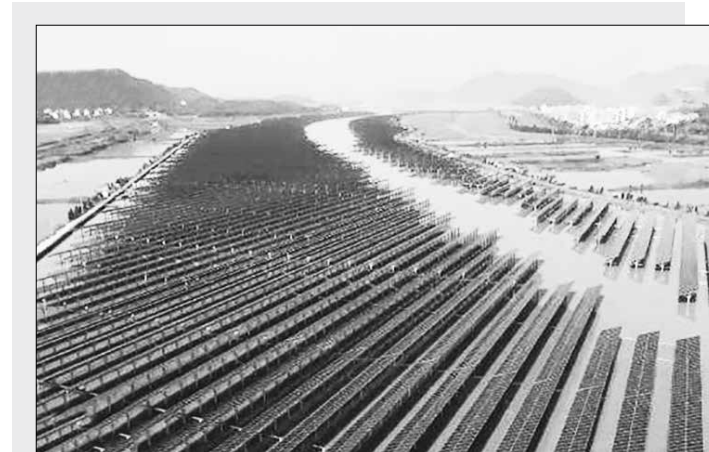
В КНР заработи централа за съвместен добив на ток от слънчева енергия и приливи и отливи

Компанията също така използва дронове, за да проследява тревните решетки и подобри ефективността на възстановителните работи. През последното десетилетие компанията добави и 1446 мупасища (около 96,4 хектара) към района.