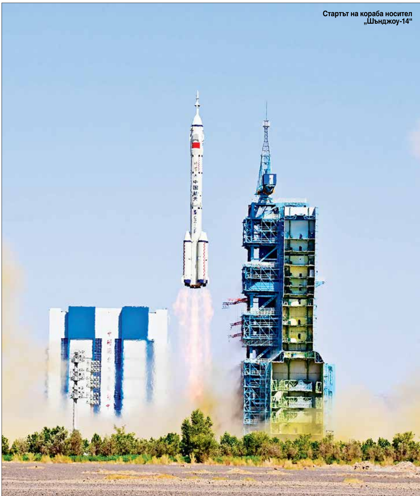
Стартът на кораба носител „Шънджоу-14“