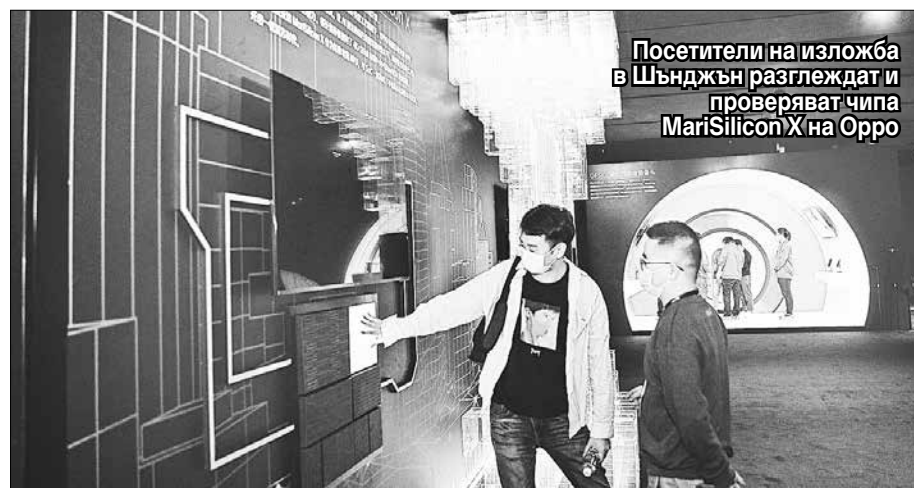
Посетители на изложба в Шънджън разглеждат и проверяват чипа MariSiliconX на Oppo