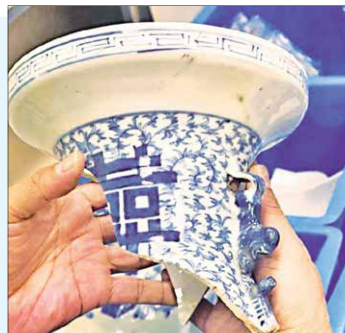
Започна изваждането на потъналия дървен кораб „Чандзянкоу-2“

рация и бизнес модел. Намаляването на цените на фотоволтаичните модули ще стимулира пазара в бъдеще, смятат авторите на доклада и очакват секторът да нарасне с около 50% през 2022 г. и да регистрира годишен ръст от около 30% в периода от 2023 до 2025 г.