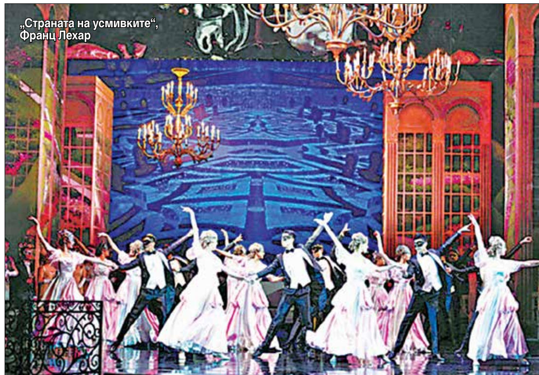
„Страната на усмивките“, Франц Лехар

Серия от популярни продукции от китайския театър и музика ще бъдат съживени и показани през предстоящия творчески сезон в Шанхайския център за ориенталско изкуство. Театърът е обявил репертоара си за 2022 г., който се състои от 73 представления на общо 49 продукции. Пекинската опера „Съпругата на танския