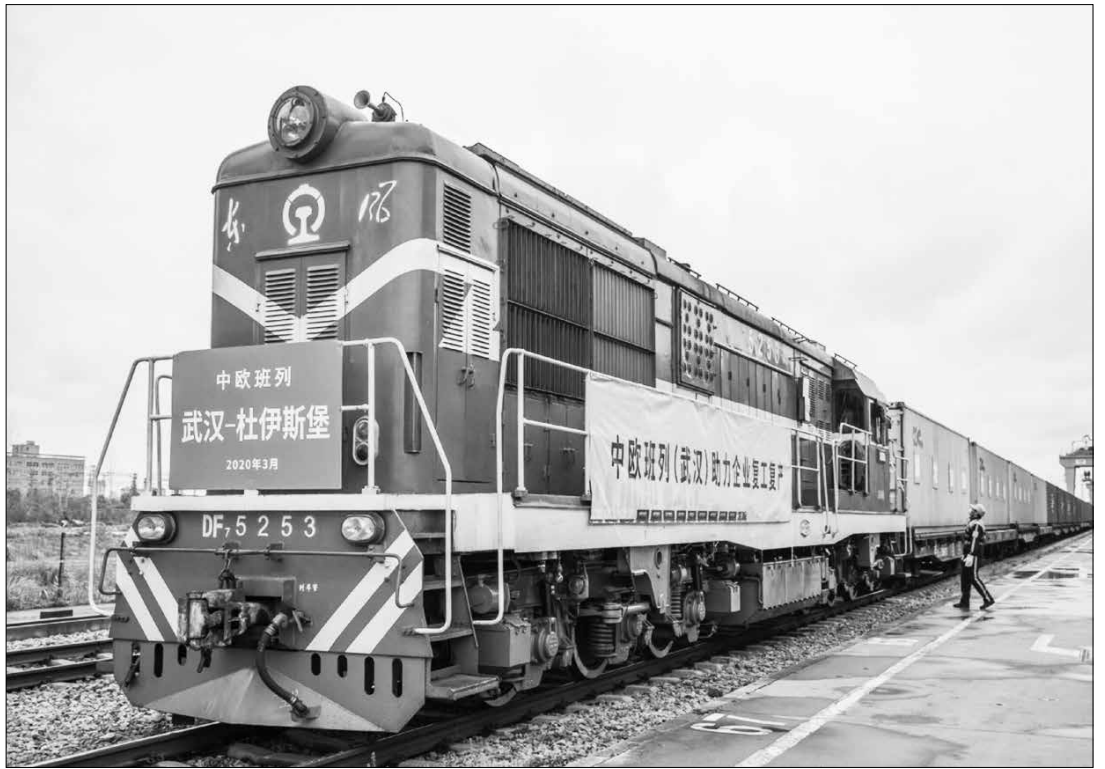
Китай ще пусне тази година нови железопътни линии с обща дължина 3300 км. Повече от 8000 км скоростни пътища ще бъдат разширени или обновени. Над 700 км висококачествени водни пътища също ще бъдат добавени или подобрени

„Обменяме информация с митническите и спедиторските фирми и отваряме „зелени“ коридори за подобряване на ефективността на митническото освобождаване“, каза той.