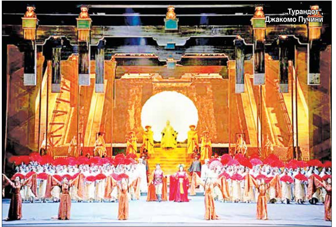
„Турандот“, Джакомо Пучини

„Оригиналната продукция беше твърде скъпа и имаше много тежък рекви-