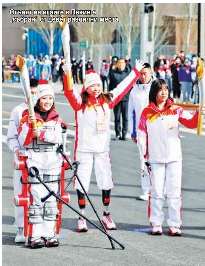
Огънят на игрите в Пекин е „събран“ от девет различни места

Зимните параолимпийски игри в Пекин са безспорно доказателство за постиженията на Китай в защитата на човешките права. През последните 6 години, придържайки се към идеята за зелена, споделена, открита и честна олимпиада, Китай положи неуморни усилия за успешното провеждане на