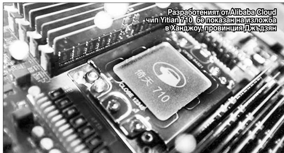
Разработеният от Alibaba Cloud чип Yitian 710 бе показан на изложба в Ханджоу, провинция Джъдзян

Друг китайски производител на автомобили Great Wall Motors събщи през декември, че е ръководил финансиращ кръг за китайската компания за чипове Synlight Crystal. Компанията не разкри конкретния размер на инвестицията си, но обяви, че ще помогне за ускоряване на бизнес