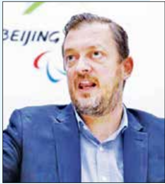
Андрю ПАРСЪНС, председател на Международния параолимпийски комитет

Вие обещахте „прости, безопасни и отлични“ игри, но резултатът е страхотни, сигурни и очарователни игри за хората с увреждания, заяви за приключилите на 13 март Зимни параолимпийски игри в Пекин председателят на Международния параолимпийски комитет Андрю Парсънс. Той коментира, че Китай е създал нов стандарт за бъдещите игри.