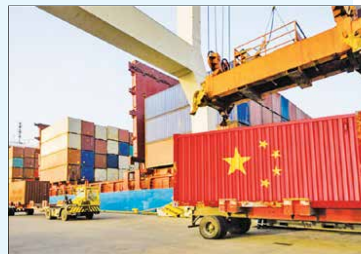
Продължава бързото увеличение на външната търговия на Китай

страната. В момента продължава строителството на АЕЦ с реактор от трето поколение „Хуалун-1“.