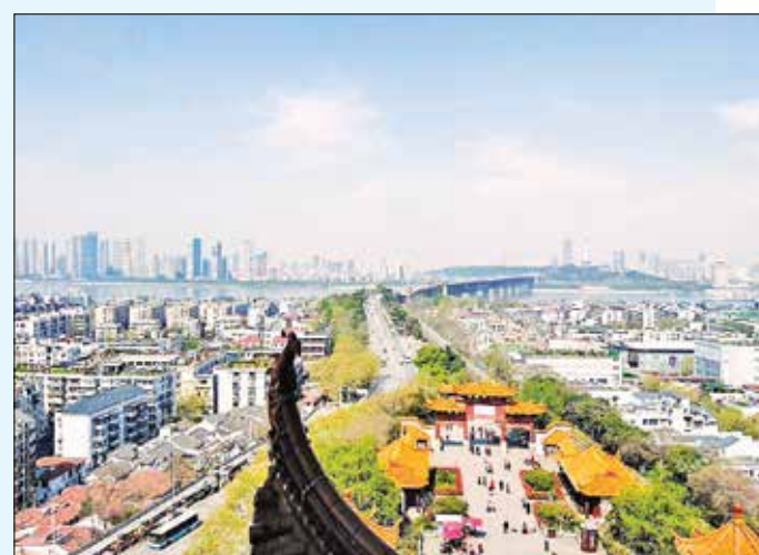
Правителството прие план за координирано развитие на градовете по средното течение на река Яндзъ

Междувременно трябва да се поддържа нормалното производство и живот на хората, да се гарантират доставките на стоки от първа необходимост и медицинското обслужване на населението, бе подчертано още на заседанието.