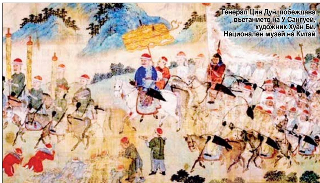
Генерал Цин Дун, побеждава въстанието на У Сангуйей, художник Хуан Би, Национален музей на Китай

– внука на последния мински император Мин, и го убива със собствените си ръце. И не само това – по негова заповед е екзекутирано цялото му семейство. Това му действие превръща У Сангуйей в най-ненавижданата и демонизирана личност за бившата минска империя и народа.