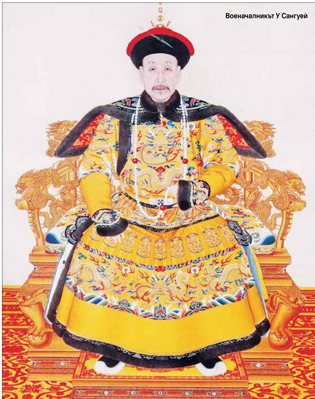
Военачалникът У Сангуйей

В същото време У Сангуйей примамва Джу Йоулан