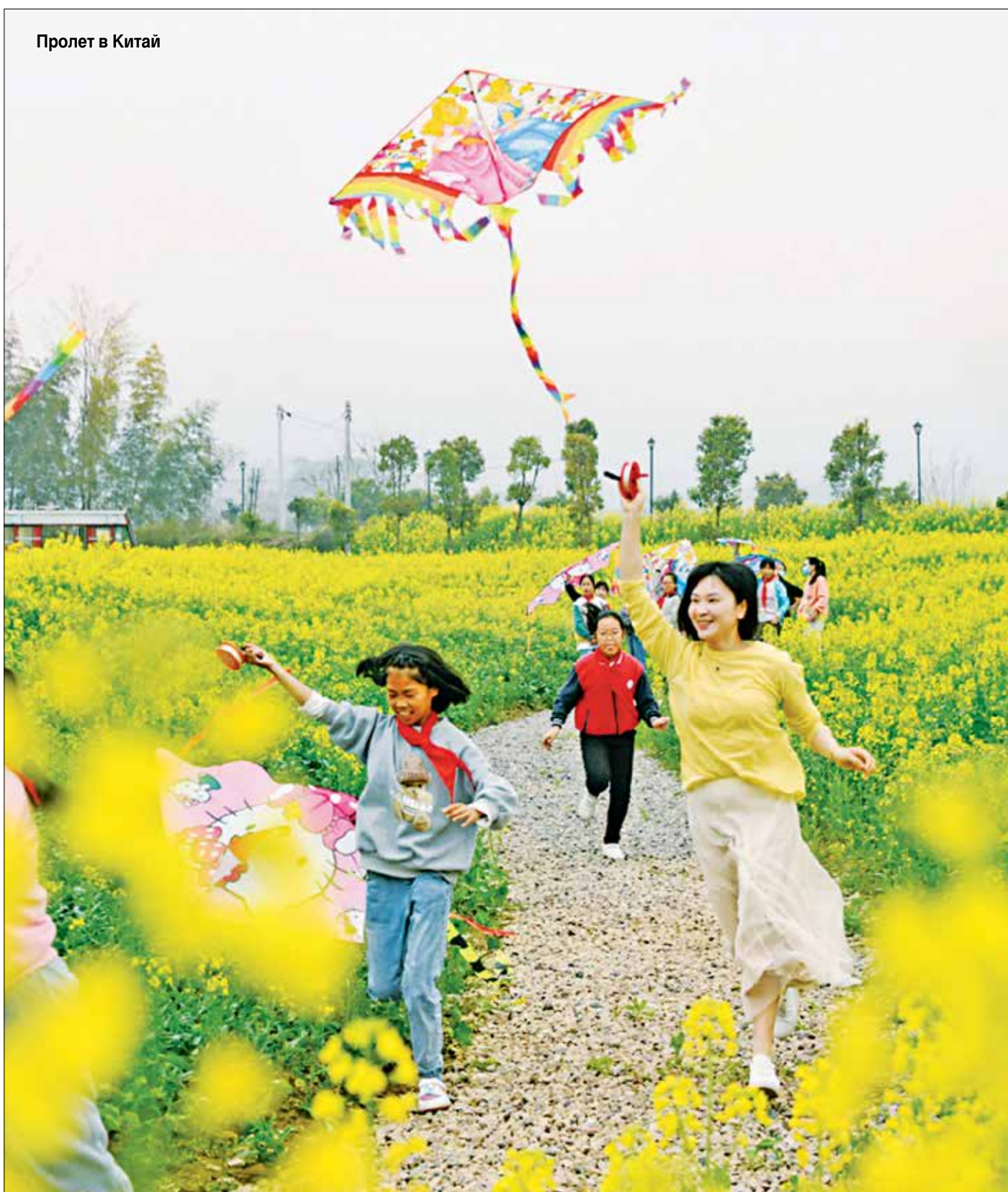
Пролет в Китай