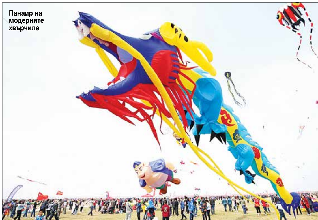
Панаир на модерните хвърчила