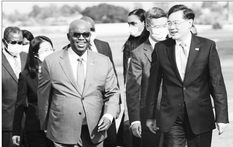
Министърът на външните работи на КНР Цин Ган и председателят на Африканския съюз Муса Факи Махамат по време на визитата на Цин Ган в столицата на Етиопия Адис Абеба

Въз основа на принципа на искреност, реални резултати, афинитет и добросъвестност, Китай също ще подкрепи Южна Африка в нейното председателство на БРИКС и Уганда в домакинството на среща на върха на Движението на необвързаните тази година.