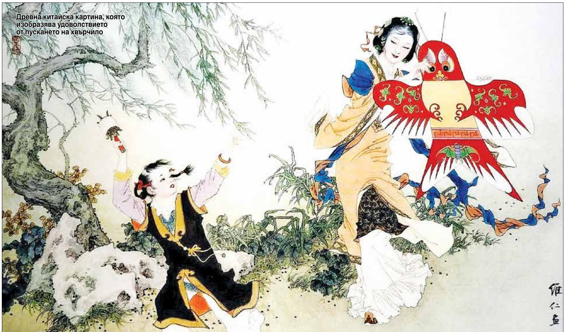
Древна китайска картина, която изобразява удоволствието от пускането на хвърчило