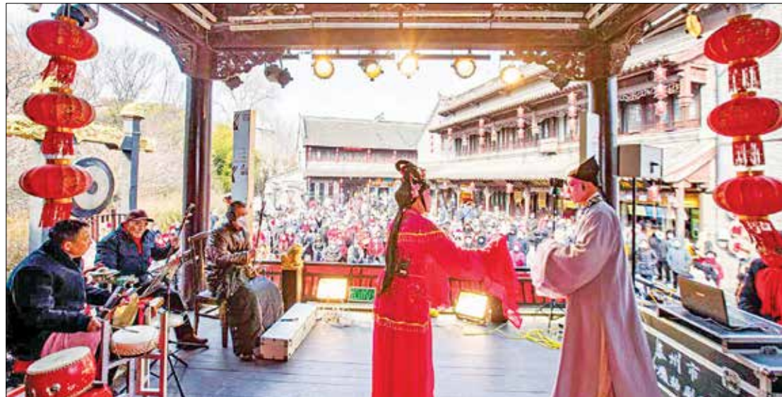
1月24日，江苏省泰州市海陵区小鹰扬剧团在泰州老街古戏台表演扬剧《珍珠塔·赠塔》选段

兔年春节假期，仅国内旅游就创造了3.08亿人次出游的疫情以来最高记录。从交通客运到影院票房，从境内外旅游到线上线下零售，各平台消费数据均在接近或恢复至疫情前水平，一些行业领域甚至大幅超过疫前水平。美国消费者新闻与商业频道网站称：“随着许多人涌向景点、观看烟花表演、挤进餐厅和酒店，被压抑的需求正在释放。”井喷式消费反弹有力拉动了内需，也为各国创造了巨大商机。中欧班列进口商品超市内，来自欧洲的商品成为中国人春节走亲访友的礼品；以中老铁路为代表的西部陆海新通道班列给中国消费者带来了新鲜的热带水果；泰国等国为欢迎中国游客在城市中心挂上灯笼，纷纷推出兔年元素……这个春节，中国人买全球、游全球为世界经济注入复苏动力，彰显出全球第二大消费市场和第一大网