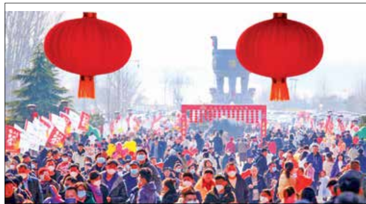
1月22日，游人在山东省临沂市沂蒙山龟蒙景区新春庙会上游玩

信心比黄金更加珍贵。当今世界经济面临疫情跌宕、通胀高企、需求转弱、地缘冲突以及能源粮食安全等多重挑战。中国春节消费热潮及其折射的经济超预期复苏令人振奋，为全球经济复苏注入了稀缺的信心资源。股市投资是感知经济信心的先导指标，香港恒生指数连续6周上涨，本月上涨14%更是“标志着至少三十年来的最佳开局”。诸多迹象表明，全球资金正涌入中国市场，投资者对中国经济的看多预期显著转强。