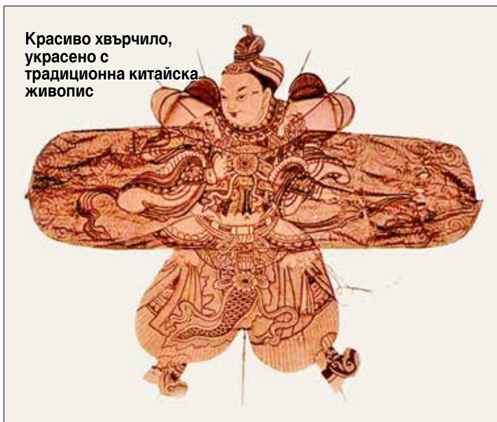
Красиво хвърчило, украсено с традиционна китайска живопис

за да се определи дали предстоящо пътуване по море ще бъде успешно или не. Това се правело, като завързвали моряк за голямо хвърчило, докато корабът се движел по посока на вятъра, като хвърляли моряка и хвърчилото от кораба. Ако хвърчилото и неговият пътник летели напред и нависоко, значи пътуването щяло да бъде успешно. Когато се връща в Италия, Марко Поло носи със себе си китайско хвърчило и скоро то става известно в цяла Европа, а от Европа пътува и в други части на света. В секцията за история на летенето в Националния музей на аеронавтиката и космоса