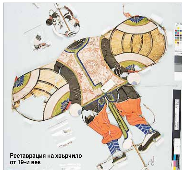
Рестаурация на хвърчило от 19-и век

Плоски, с твърди крила, с меки крила и стеножки са различни структурни форми, използвани за всички тези хвърчила. Стеножките са хвърчила влакчета с глава на дракон и последователност от еднакво оразмерени дискове. Главата и дисковете са свързани помежду си с една или по-често три линии и имат огромна въздушна тяга. Тези хвърчила предоставят впечатляващ изглед по време на полет особено когато вятърът