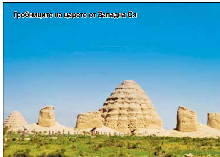
Гробниците на царете от Западна Ся

Днес ще разкажа за годжи бери, или вълчатата ягода, както я наричат.