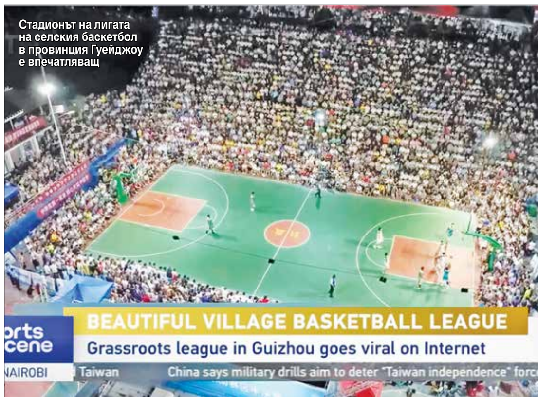
Стадионът на лигата на селския баскетбол в провинция Гуйджоу е впечатляващ

По време на традиционния селски фестивал, който се пада на шестия ден от шестия месец от китайския лунен календар,