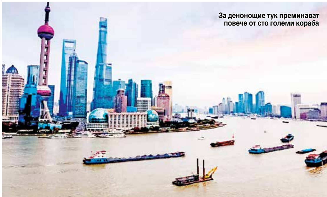
За денонощие тук преминават повече от сто големи кораба

Трудността идва от факта, че огромната Яндзъ ежедневно довлича десетки тонове тиня в своето устие.