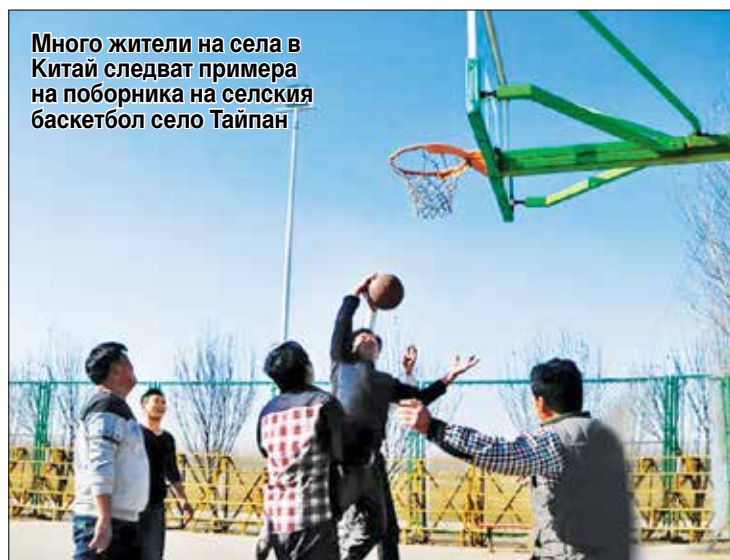
Много жители на села в Китай следват примера на поборника на селския баскетбол село Тайпан

село Тайпан ще бъде домакин на баскетболен турнир. Ще бъдат поканени жители на съседните села и градове, за да отпразнуват заедно изобилната реколта.