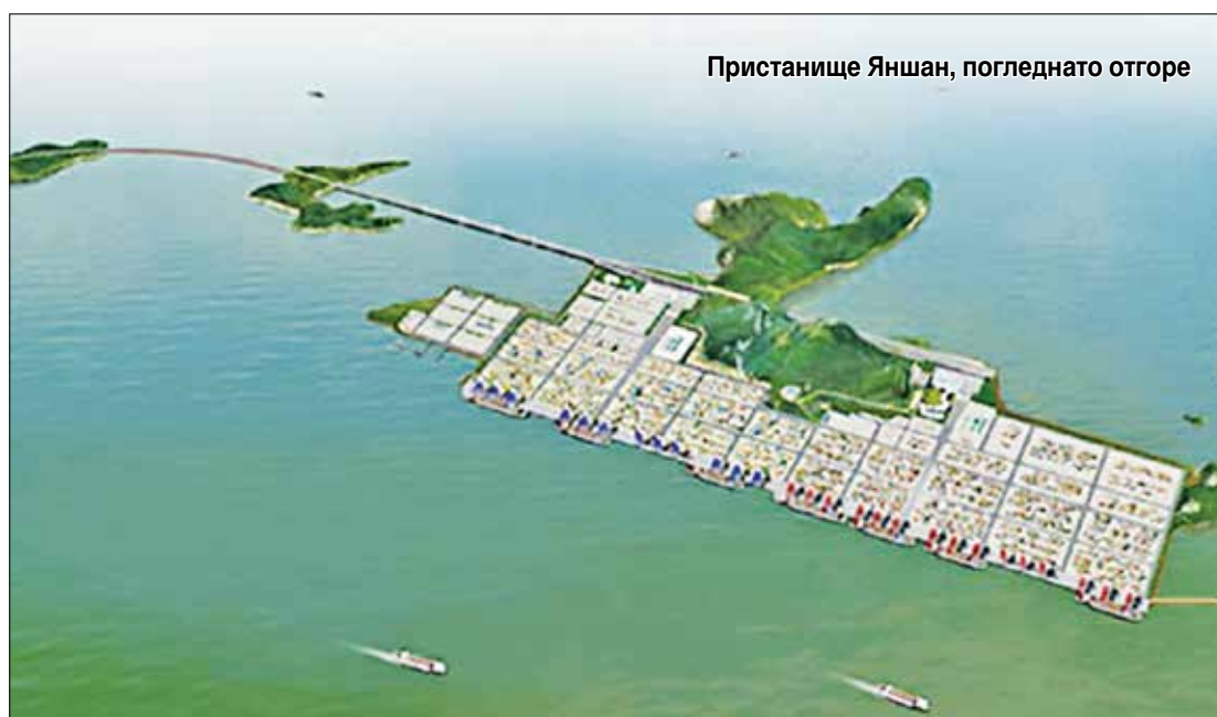
Пристанище Яншан, погледнато отгоре

А от другата страна на моста, на материка, на територия от 1120 декара е построен обширният