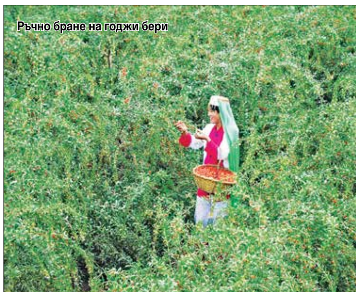
Ръчно бране на годжи бери

През 3-и век пр. н. е. районът е бил присъединен от династията Цин. Той е служел като буферна зона