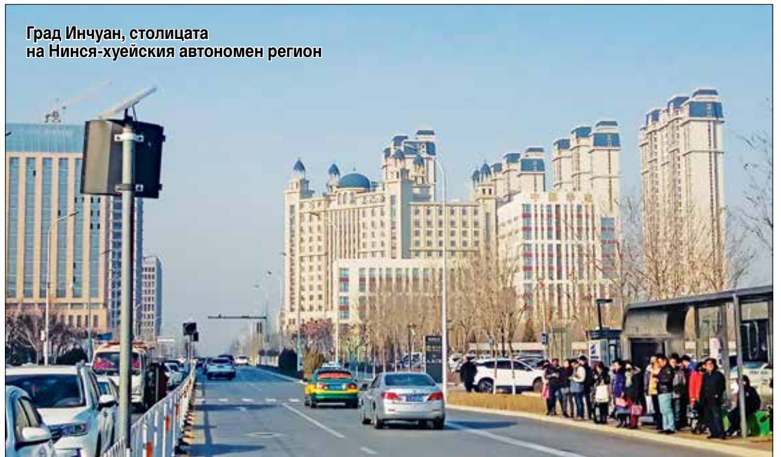
Град Инчуан, столицата на Нинся-хуейския автономен регион

Когато се заговори за него, веднага изникват в съзнанието годжи бери, вино и агнешко месо.