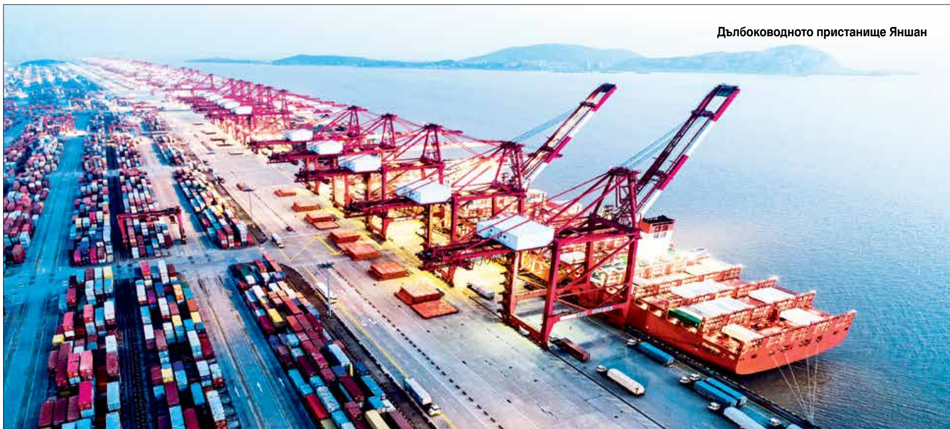
Дълбоководното пристанище Яншан

Изправено пред истински бум в морското транспортно строителство, правителството на Шанхай се решава на революционна стъпка: прави пристанище... в открито море, на 32 километра от брега. Избраната точка е неголемият остров Яншан – купчина скали и вечнозелени гори, по чиито брегове китайски рибари изкарват хляб си със своите джонки – малки платноходки, съхранили вековна мореплавателна традиция. И именно тук, до неголемия, никому неизвестен остров, Шанхай оформя изкуствен железобетонен пристан с дължина двайсет километра, способен да приеме и обработи едновременно десетки транспортни съдове.